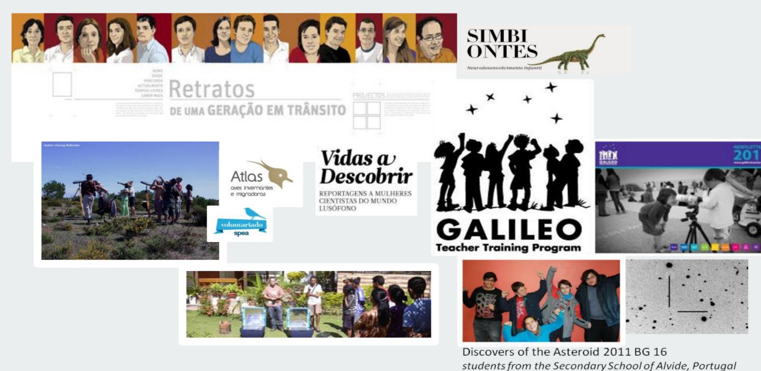
Discovers of the Asteroid 2011 BG 16 students from the Secondary School of Alvide, Portugal

São mais pontuais ou circunscritas a um menor número de associações iniciativas como olimpíadas para jovens e outros concursos, comemorações temáticas (ex. Semana Internacional do Cérebro), a participação em projetos de ensino experimental das ciências, dias de “portas abertas” ou de visitas a laboratórios ou a organização de exposições temáticas.