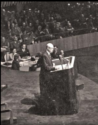
Eisenhower no célebre discurso «Átomos para a Paz»